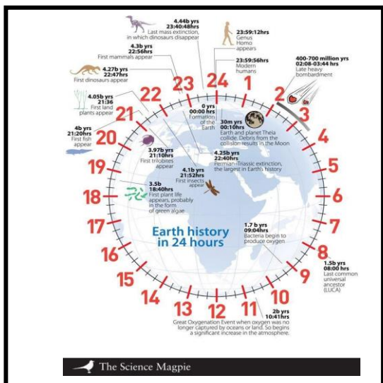
Document 4 : Histoire de la Terre ( en 24h )